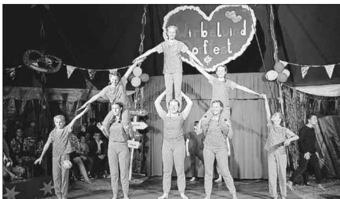
Teamwork in der Manege: Mädchen unterschiedlichen Alters studierten 2025 beim Circus Wirbelwind in Neubrunn gemeinsam eine Nummer ein.

Die Anmeldung ist ab dem 15. Januar 2026 über das Portal www.jugend-landkreis-wue.de (Stichwort: Jahresprogramm) möglich. Die Plätze werden nach Eingangsdatum vergeben. Für weitere Informationen steht die Kommunale Jugendarbeit des Landkreises Würzburg gerne zur Verfügung (Tel. 0931/8003-5842, E-Mail: jahresprogramm@lra-wue.bayern.de ).